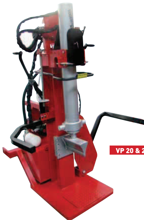
VP 20 & 25